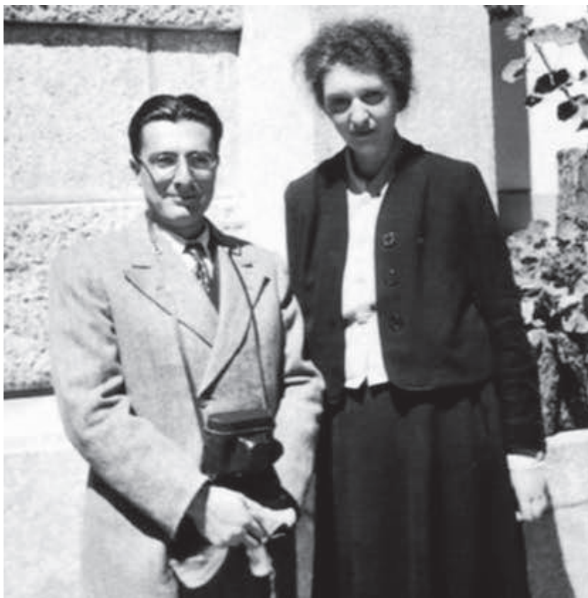
DINU LIPATTI ȘI CLARA HASKIL (1895 – 1960)